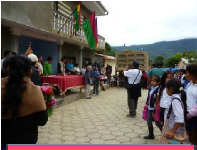
ACTO CIVICO FRENTE A LA ALCALDIA DE TEOPONTE A LA VISITA DE CHATO PERDO