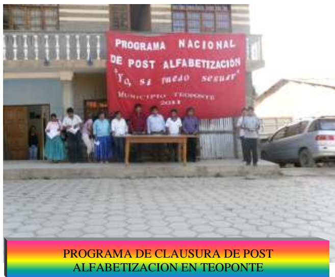
PROGRAMA DE CLAUSURA DE POST ALFABETIZACION EN TEOPONTE