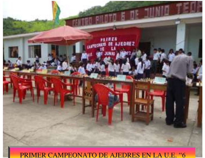
PRIMER CAMPEONATO DE AJEDRES EN LA U.E. "6 DE JUNIO DE TEOPONTE"