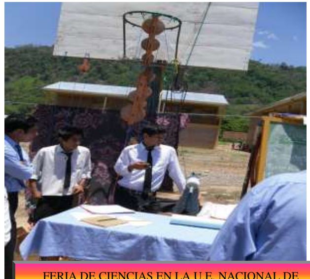
FERIA DE CIENCIAS EN LA U.E. NACIONAL DE TEOPONTE