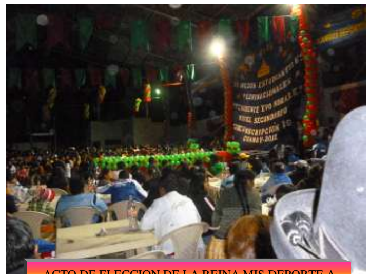
ACTO DE ELECCION DE LA REINA MIS DEPORTE A NIVEL C - 19 EN GUANAY