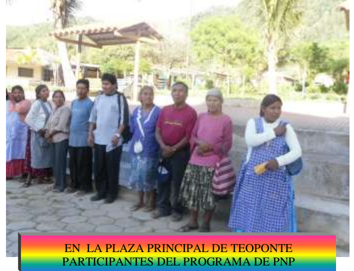
EN LA PLAZA PRINCIPAL DE TEOPONTE PARTICIPANTES DEL PROGRAMA DE PNP