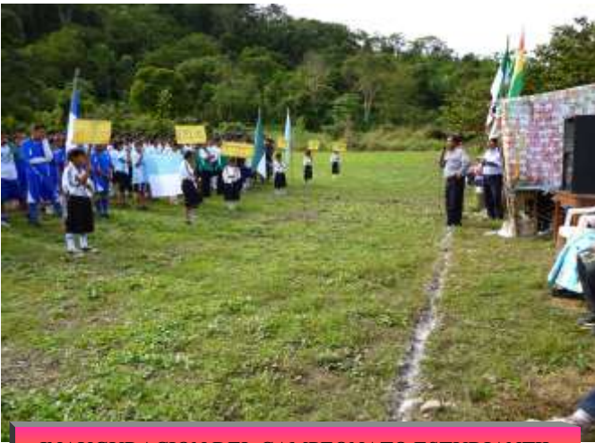
INAUGURACION DEL CAMPEONATO ESTUDIANTIL EN SANTO DOMINGO PARA LOS JUEGOS PLURINACIONALES