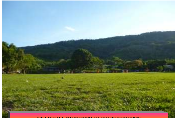
STADIUM DEPORTIVO DE TEOPONTE