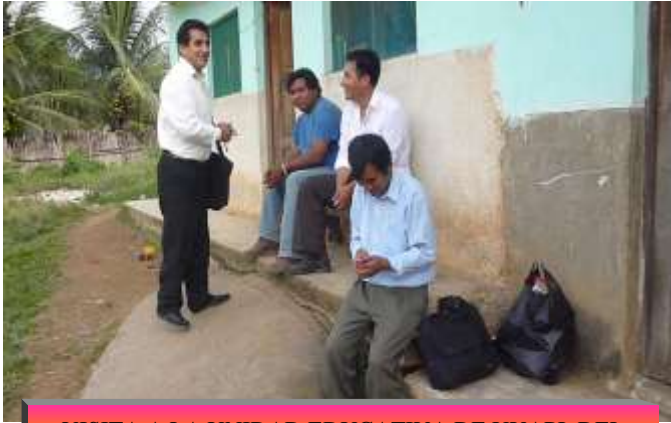
VISITA A LA UNIDAD EDUCATIVA DE UYAPI DEL NUCLEO DE TEOPONTE