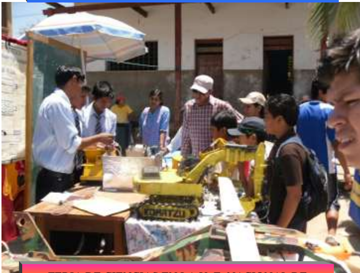
FERIA DE CIENCIAS EN LA U. E. NACIONAL DE TEOPONTE