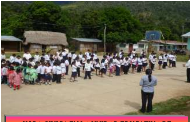
HORA CIVICA EN LA UNIDAD EDUCATIVA DE UYAPI