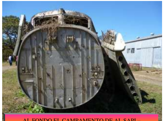
AL FONDO EL CAMPAMENTO DE AL SAPI - COMSUR Y UN AVION DESMANTELADO DURANTE LA EXPLOTACION DEL .ORO EN TEOPONTE