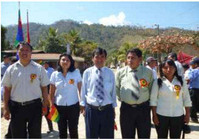
PERSONAL DE LA DIRECCION DISTRICTAL DE TEOPONTE Y DIRECTORES DESPUES DEL DESFILE CIVICO DEL 6 DE AGOSTO