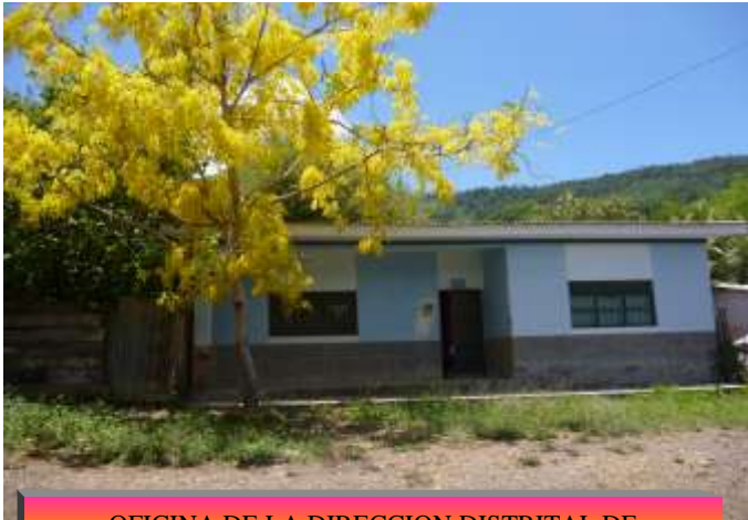
OFICINA DE LA DIRECCION DISTRITAL DE EDUCACION DE TEOPONTE