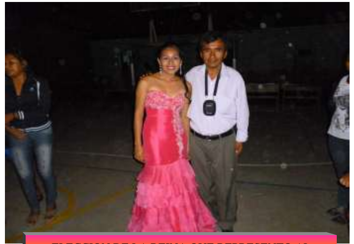
ELECCION DE LA REINA QUE REPRESENTO AL DISTRITO DE TEOPONTE EN GUANAY