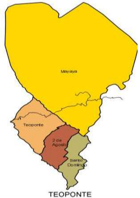
MAPA DEL MUNICIPIO DE TEOPONTE

El Distrito Educativo de Teoponte está ubicado en la localidad de Teoponte, Cantón Teoponte, Octava Sección Municipal de la Provincia Larecaja del Departamento de La Paz del Estado Plurinacional de Bolivia. Está ubicada en la zona amazónica de los yungas a una altura que varía de 346 a 3943 msnm y a una distancia de 270 km. de la sede de gobierno con acceso vial: La Paz – Yolosa -- Caranavi – Teoponte (Capital de Sección).