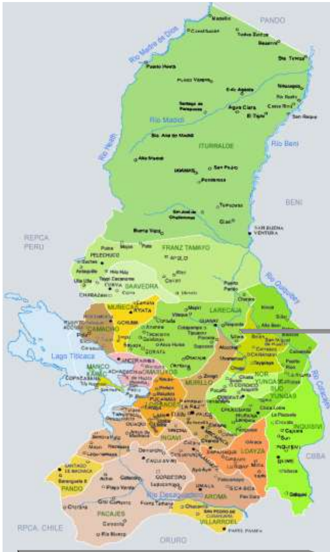
MAPA DEL DEPARTAMENTO DE LA PAZ

El Distrito Educativo de Teoponte está ubicado en la localidad de Teoponte, Cantón Teoponte, Octava Sección Municipal de la Provincia Larecaja del Departamento de La Paz del Estado Plurinacional de Bolivia. Está ubicada en la zona amazónica de los yungas a una altura que varía de 346 a 3943 msnm y a una distancia de 270 km. de la sede de gobierno con acceso vial: La Paz – Yolosa -- Caranavi – Teoponte (Capital de Sección).