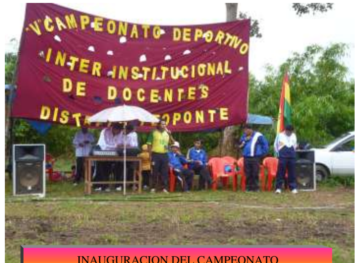
INAUGURACION DEL CAMPEONATO INTERINSTITUCIONAL DE DOCENTES DE TEOPONTE EN VILLA AROMA