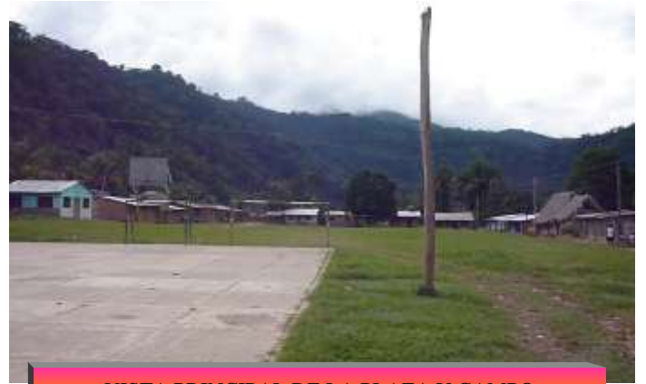
VISTA PRINCIPAL DE LA PLAZA Y CAMPO DEPORTIVO DE UYAPI