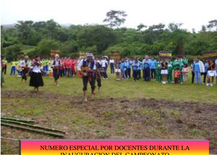
NUMERO ESPECIAL POR DOCENTES DURANTE LA INAUGURACION DEL CAMPEONATO INTERINSTITUCIONAL DE DOCENTES DE TEOPONTE