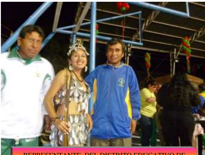
REPRESENTANTE DEL DISTRITO EDUCATIVO DE TEOPONTE EN LA ELECCION DE MIS DEPORTE C - 9