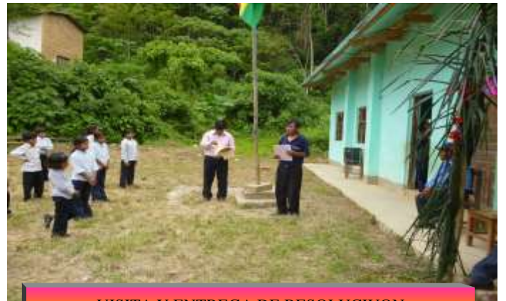
VISITA Y ENTREGA DE RESOLUCIUN ADMINISTRATIVA U. E. NUEVA ESTRELLA