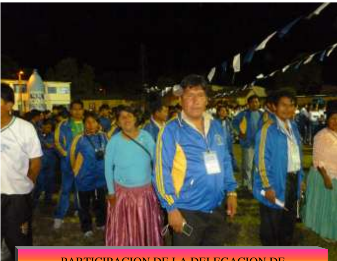
PARTICIPACION DE LA DELEGACION DE TEOPONTE A NIVEL DE C - 19 EN GUANAY