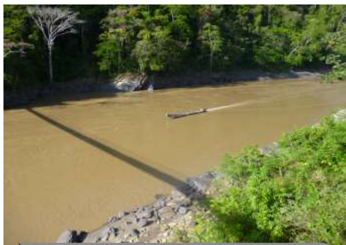
CANOA SOBRE EL RIO K'AKA PARA IR DE VISITA A LA U.E. UYAPI